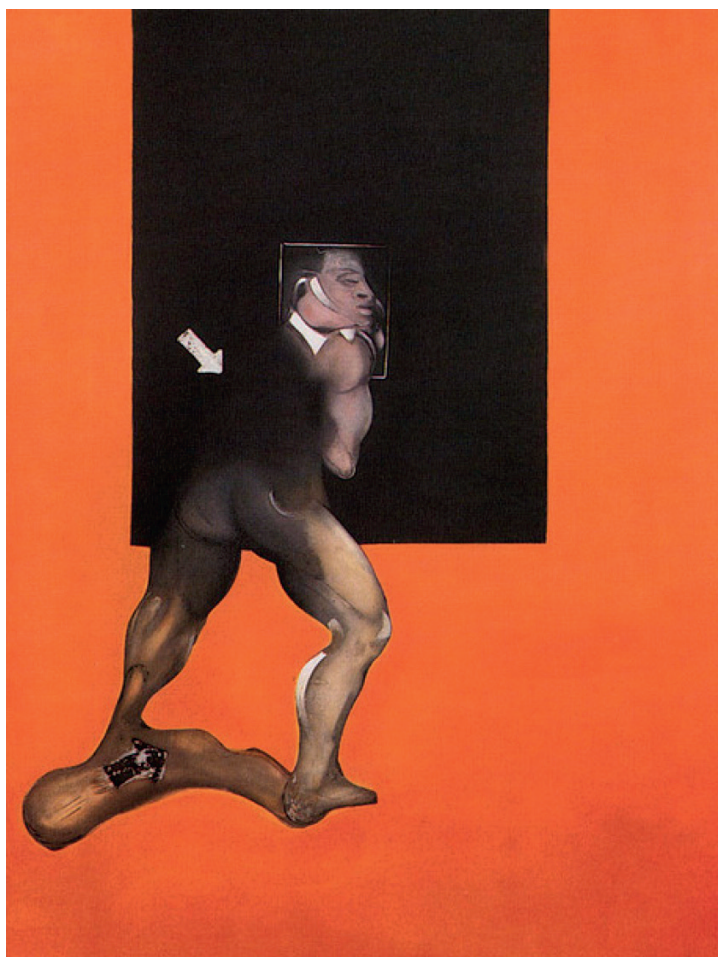
Francis Bacon - Etude du corps humain - (1987) Coll. particulière